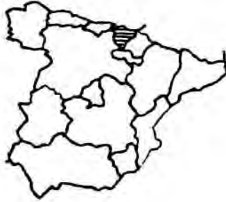
FIGURA 3. Ubicación de la Comunidad Autónoma del País Vasco.