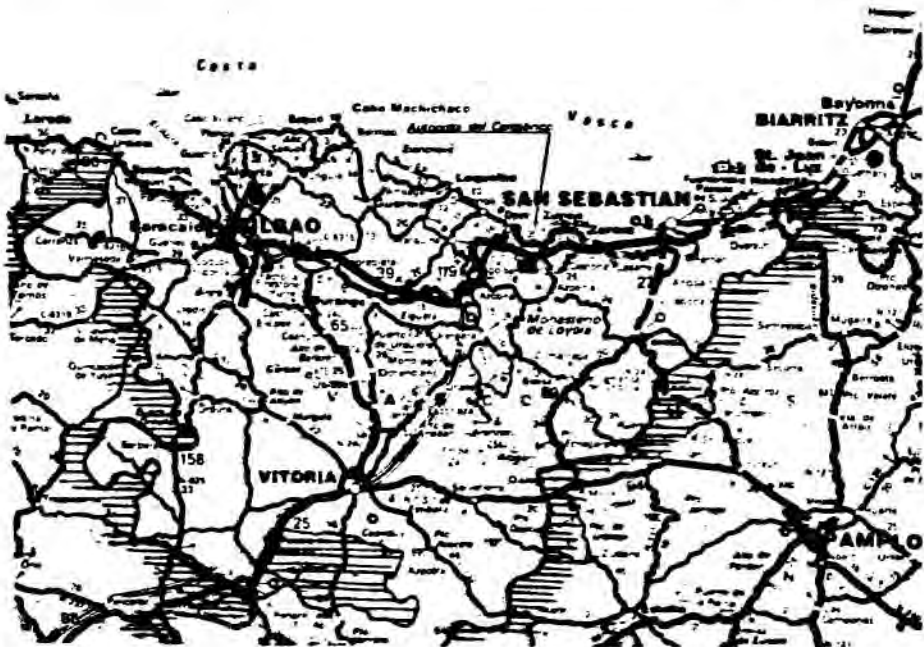
FIGURA 4. Características espaciales del País Vasco.