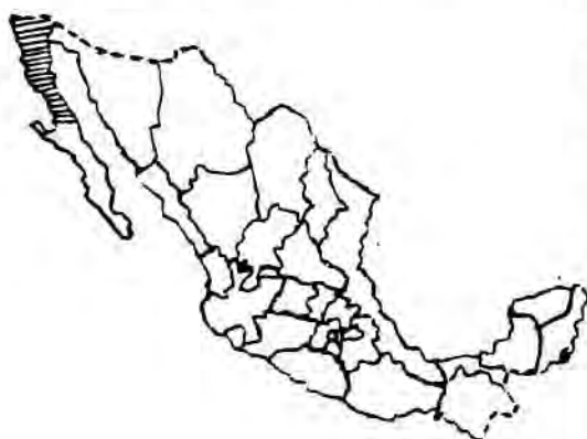
FIGURA 1. Ubicación del estado Baja California.

La península de Baja California la forman los estados de Baja California y Baja California Sur. Es al primero de ellos al que se refiere este estudio. Su longitud es de 760 km y su anchura media de 140 km. En 1980, su extensión territorial era de 69,921 km (el 3.6% de la superficie de la república) y su población de 1'177,886 personas (el 1.8% de la población mexicana). De esta forma, su densidad demográfica era de sólo 16.8 habitantes por km 2 , frente a 34.1 habitantes, que constituye la media de las 32 entidades federativas que componen el país (INEGI). No obstante estos datos generales, existe una fuerte heterogeneidad en la ocupación del territorio cuyas causas económicas serán analizadas en el siguiente apartado.