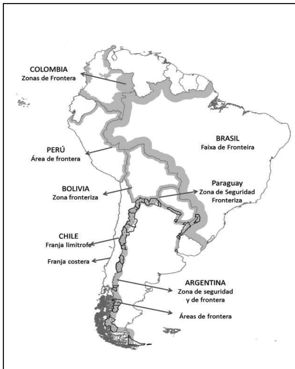
Figura 2. Denominación de los polígonos fronterizos en Sudamérica, según país