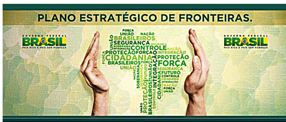
Figura 4. Brasil “desprendido”