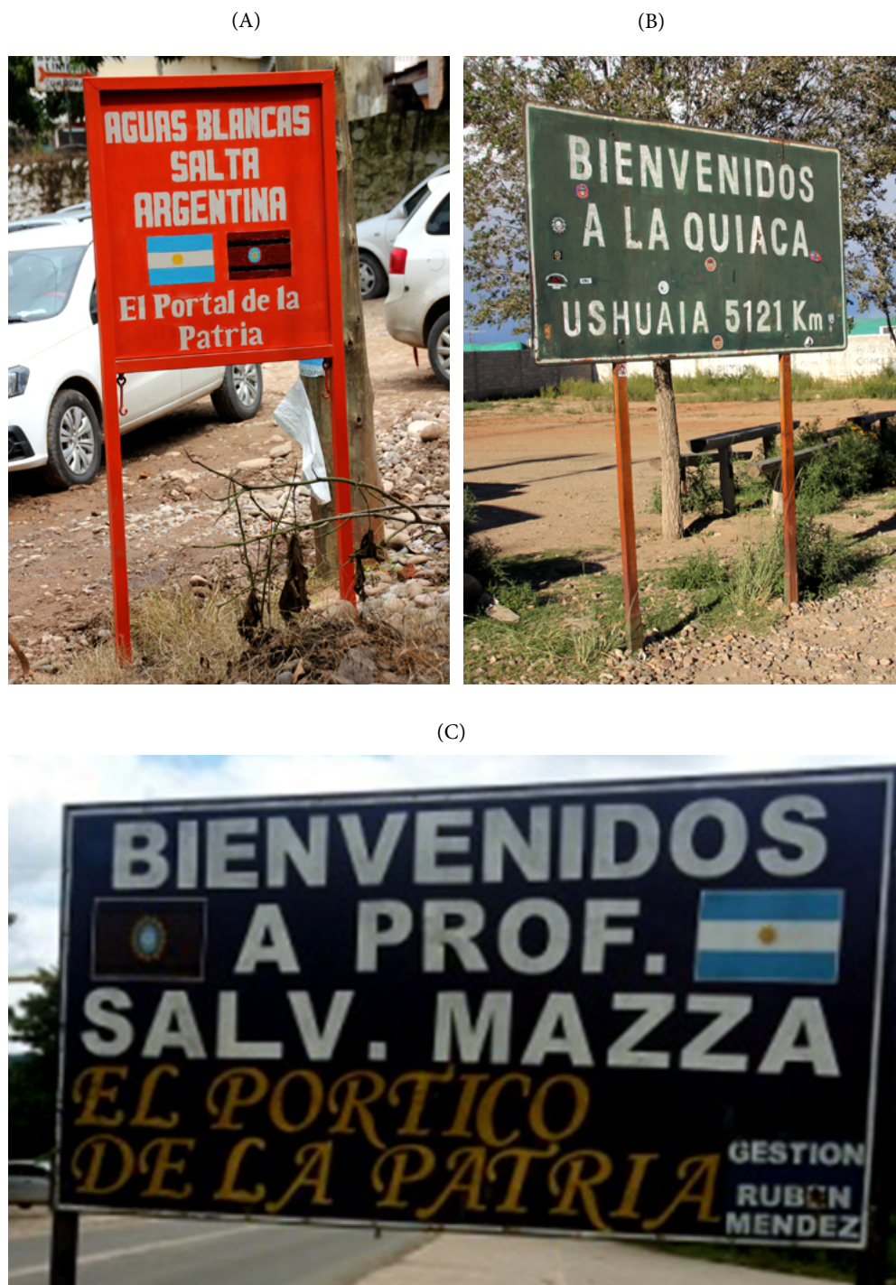
Figura 1. Carteles ubicados en las ciudades fronterizas de Aguas Blancas (A); en Profesor Salvador Mazza (B); en La Quiaca (C), en la República Argentina

Fuente: Fotografías de Alejandro Benedetti, 2018.