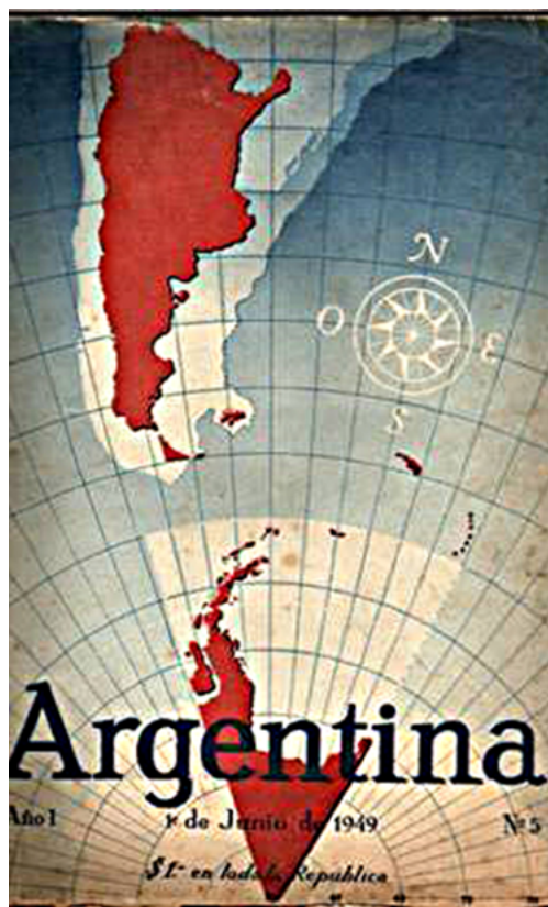
Figura 3. La Argentina “desprendida”