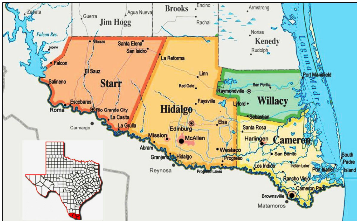
Figura 4: Condados y ciudades del Valle de Río Grande